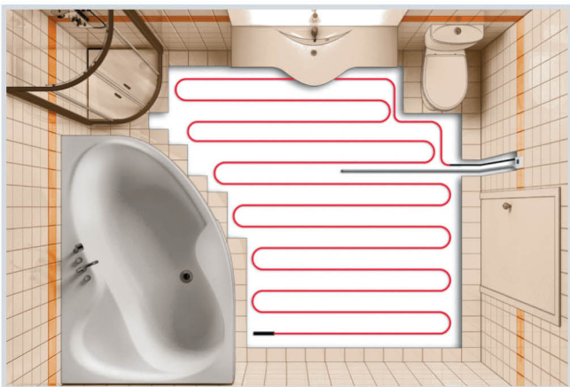
Схема укладки кабеля на свободную площадь