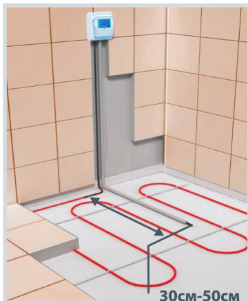
Схема укладки датчика температуры в гофрированной трубке